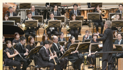
洗足スペシャル・ウインド・ワールド(SSWW)

忘れてはいけない吹奏楽邦人作品の名曲の数々と、2024年度吹奏楽コンクール課題曲全4曲をお届けします。