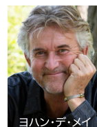
ヨハン・デ・メイ

指揮 ヨハン・デ・メイ (客演指揮者) 演奏 洗足スペシャル・ウインド・ワールド